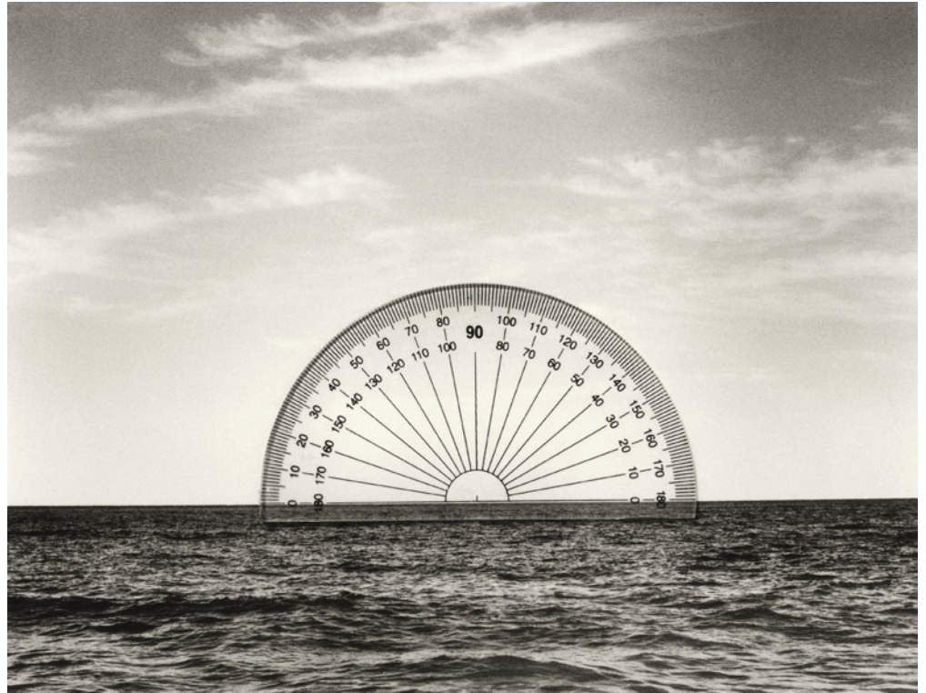
Chema Madoz, Sans titre , 2007 Tirage gélatino-argentique, 16 x 26 cm Edition de 25

L'utilisation des visuels est exclusivement réservée à la promotion de l'exposition et valable jusqu'à sa date de clôture.