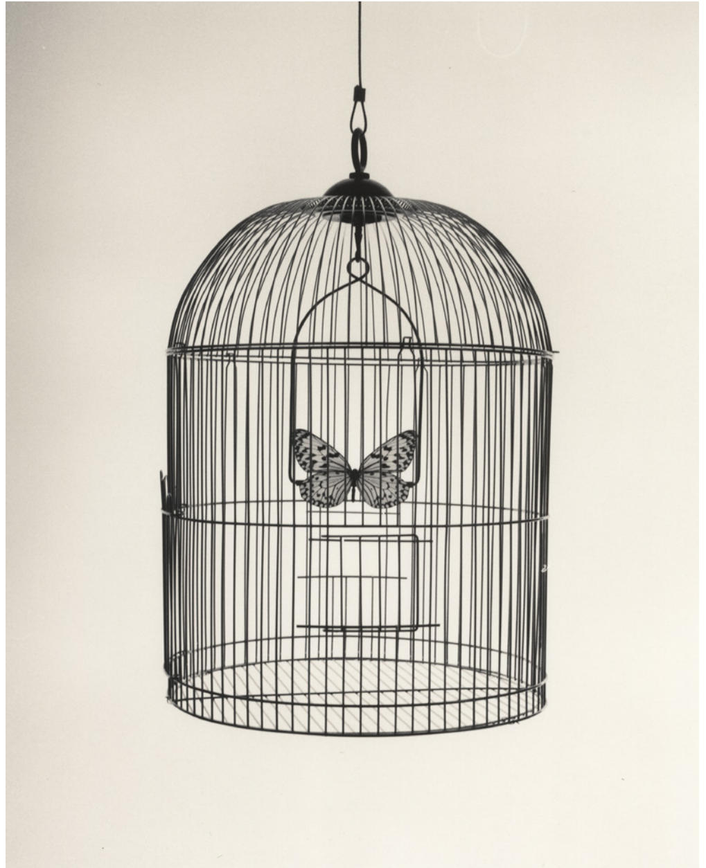
Chema Madoz, Sans titre , 2010 Tirage gélantino-argentique, 60 x 50 cm Edition de 15

L'utilisation des visuels est exclusivement réservée à la promotion de l'exposition et valable jusqu'à sa date de clôture.