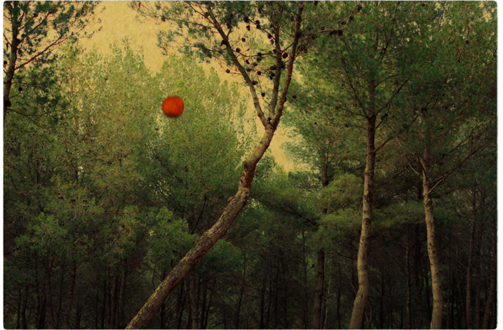
Albarrán Cabrera, The Mouth of Krishna #724 , 2018 Tirage pigmentaire sur papier japonais et feuille d'or, 25 x 17 cm Édition de 20

L'utilisation des visuels est exclusivement réservée à la promotion de l'exposition et valable jusqu'à sa date de clôture. Mention obligatoire : © Albarrán Cabrera, Courtesy Galerie Esther Woerdehoff