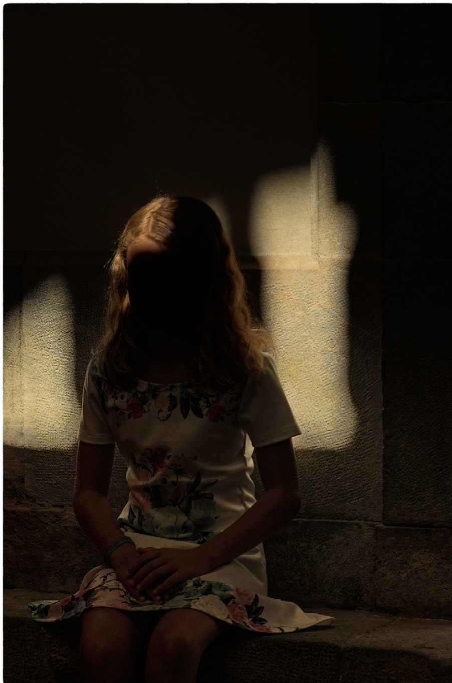
Albarrán Cabrera, This is you here #147 , 2019 Tirage pigmentaire sur papier japonais et feuille d'or, 25 x 16,5 cm Édition de 20

L'utilisation des visuels est exclusivement réservée à la promotion de l'exposition et valable jusqu'à sa date de clôture.