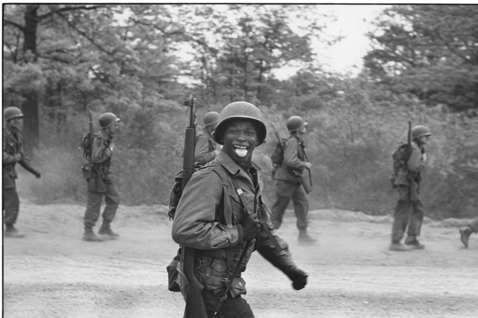
Elliott Erwitt, Fort Dix, Burlington County, New Jersey , 1951 Tirage argentique 20,5 x 30 cm

L'utilisation des visuels est exclusivement réservée à la promotion de l'exposition et valable jusqu'à sa date de clôture.