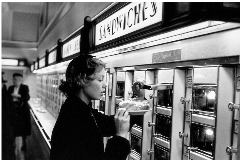
Elliott Erwitt, Automat. New York City , 1953 Tirage argentique 21,3 x 31,8 cm