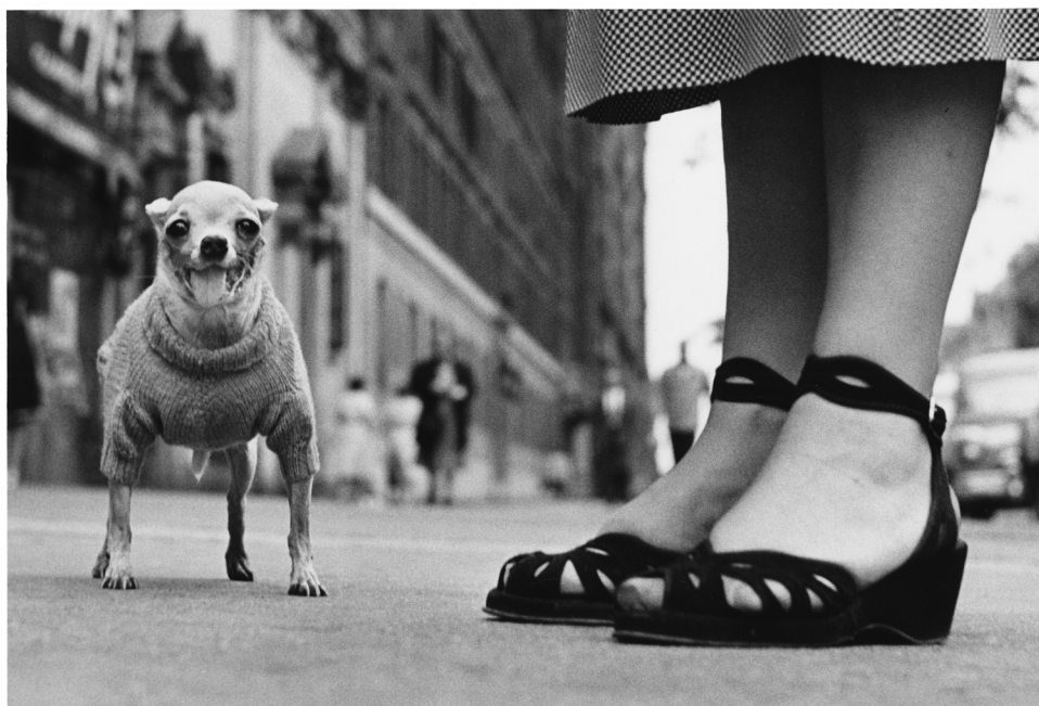
Elliott Erwitt, New York City , 1946 Tirage argentique 21 x 30,5 cm

L'utilisation des visuels est exclusivement réservée à la promotion de l'exposition et valable jusqu'à sa date de clôture.