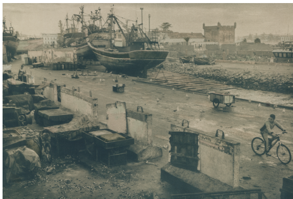
Aassmaa Akhannouch, Le vieux port, 2023 Série Un monde oublié Cyanotype viré et rehaussé à l'aquarelle sur papier beaux arts

L'utilisation des visuels est exclusivement réservée à la promotion de l'exposition et valable jusqu'à sa date de clôture.