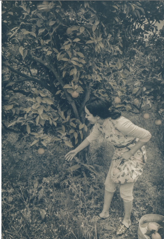
Aassmaa Akhannouch, Le printemps, 2023 Série Un monde oublié Cyanotype viré et rehaussé à l'aquarelle sur papier beaux arts