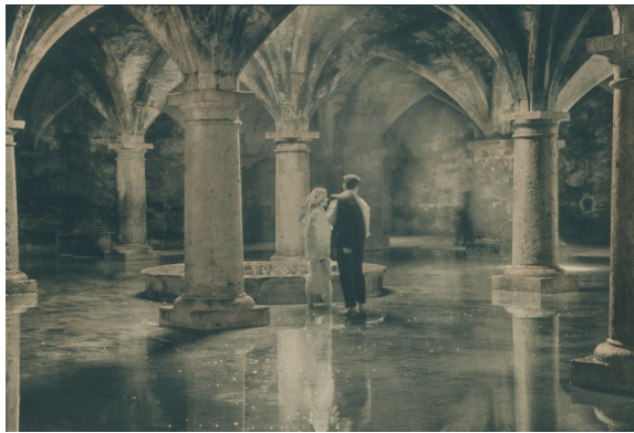
Aassmaa Akhannouch Les fiancés, 2023 Série Un monde oublié, cyano- type viré et rehaussé à l'aquarelle sur papier beaux arts

L'utilisation des visuels est exclusivement réservée à la promotion de l'exposition et valable jusqu'à sa date de clôture.