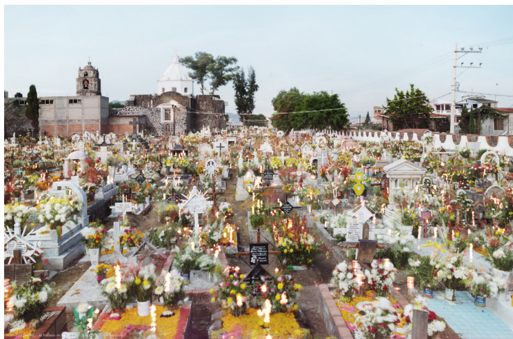
Michael Wesely, B6649 Série Mexico , tirage pigmentaire Pièce unique, 43 x 66 cm

L'utilisation des visuels est exclusivement réservée à la promotion de l'exposition et valable jusqu'à sa date de clôture.