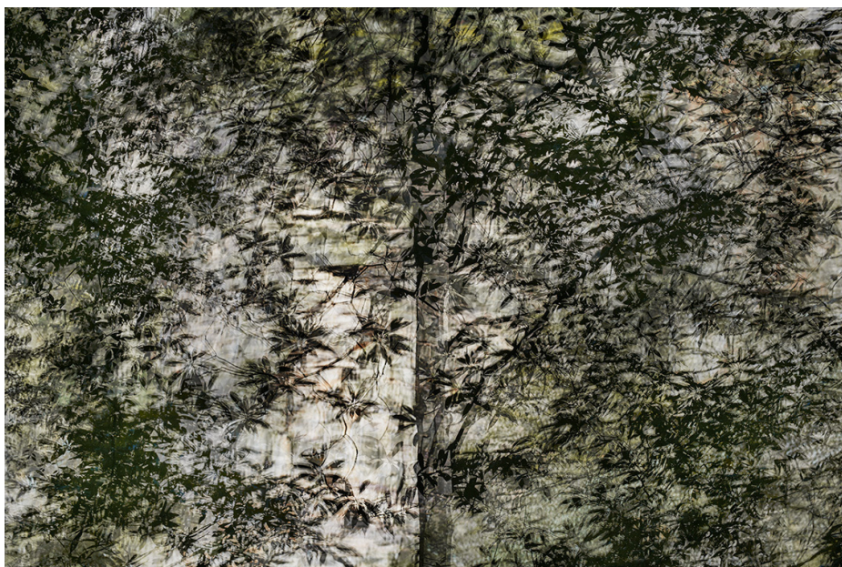
Éric Bourret, Zhangjiajie, Chine #5788 , 2018 Pigment inkjet print on archival paper 120 x 90 cm, edition of 3

The use of images is exclusively reserved for the promotion of the exhibition and valid up to its end.