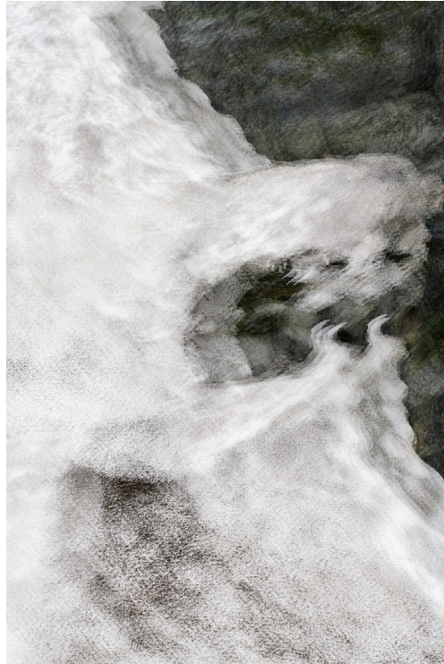
Éric Bourret, Pangaea , 2020 Pigment inkjet print on archival paper 140 x 195 cm, edition of 3