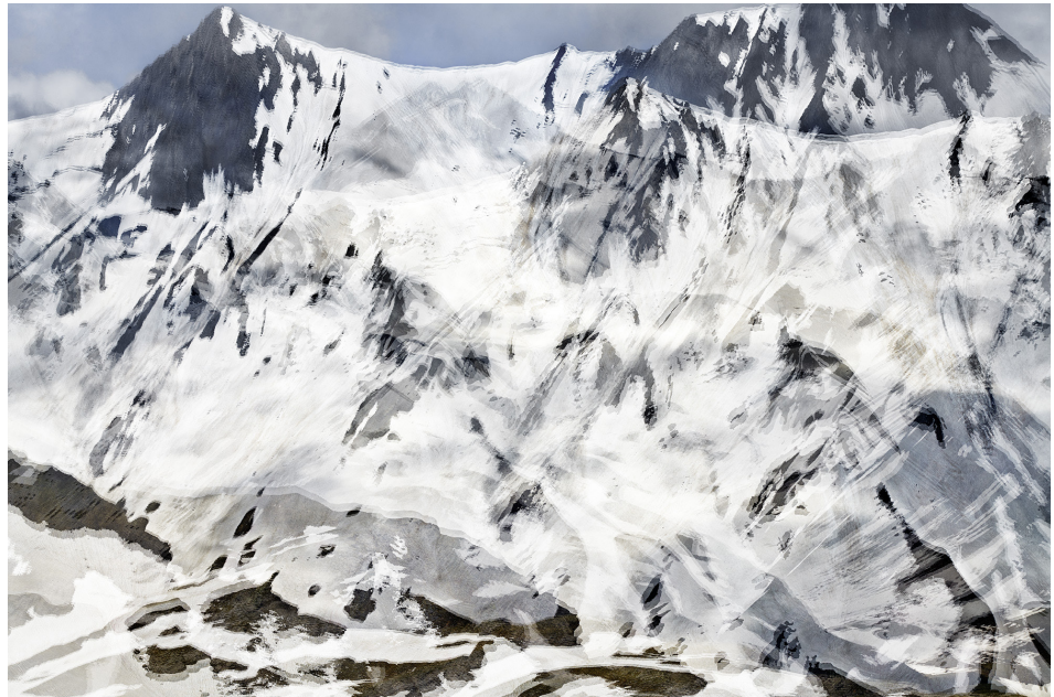
Éric Bourret, Pangaea , 2020 Pigment inkjet print on archival paper 140 x 195 cm, edition of 3

The use of images is exclusively reserved for the promotion of the exhibition and valid up to its end.