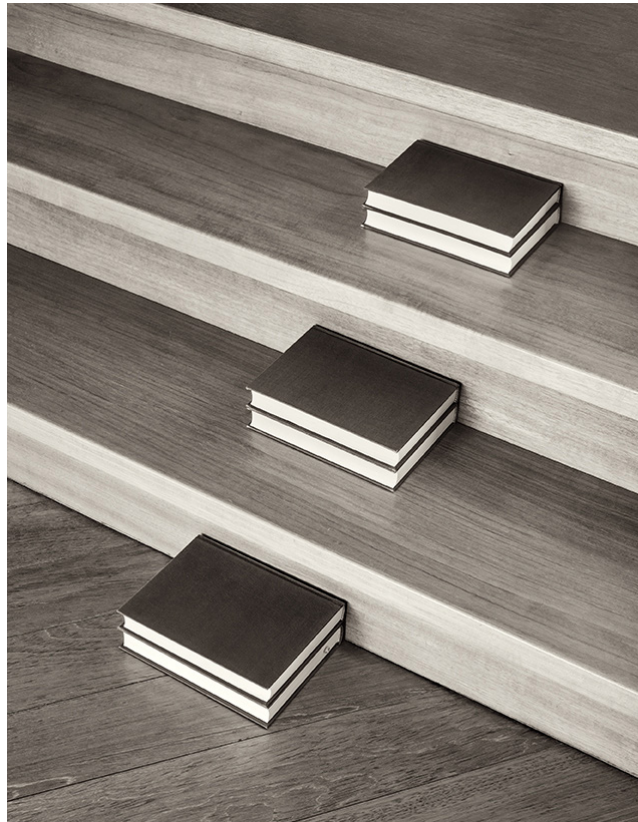
Chema Madoz, sans titre, 2022 Tirage pigmentaire sur papier archivage, 50 x 60 cm