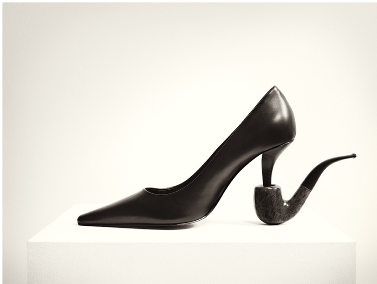
Chema Madoz, sans titre, 2023 Tirage pigmentaire sur papier archivage, 50 x 60 cm

L'utilisation des images est exclusivement réservée à la promotion de l'exposition et valable jusqu'à sa fin.