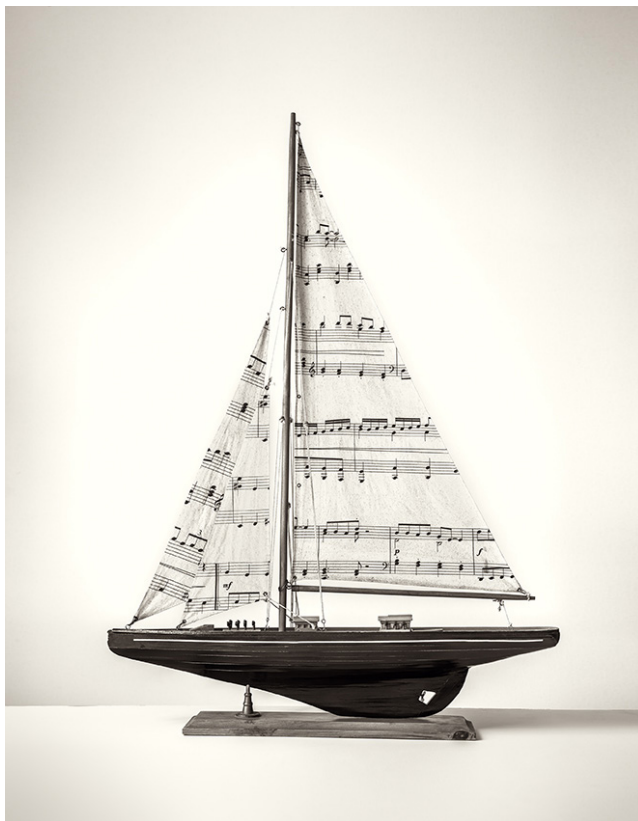
Chema Madoz, sans titre, 2022 Tirage pigmentaire sur papier archivage, 50 x 60 cm